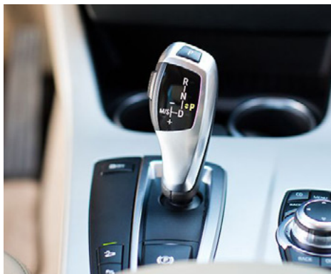
Variante #1 (JL-001)

i Bitte kontrollieren Sie im BMW-Fahrzeug die verbaute Joystick-Variante des Automatikgetriebes. JoyLock ist mittlerweile für die 3 gängigsten Joystick-Varianten verfügbar.