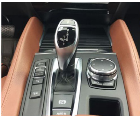
Variante #2 (JL-002)