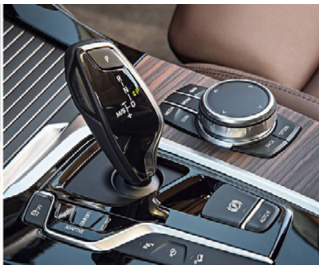
Variante #3 (JL-003)